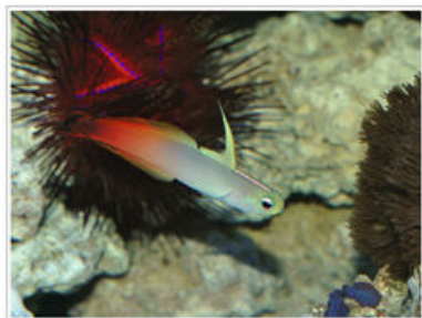
Le Guide Pratiche

Tra i diversi tipi possibili di acquari, quello marino tropicale è senza dubbio il più colorato, esotico, affascinante, misterioso. Si tratta di un tipo di acquari che spesso viene sconsigliato, per la sua apparente complessità. In realtà chiunque sappia gestire bene un acquario d'acqua dolce è in grado di realizzare e mantenere in perfette condizioni un acquario marino tropicale. La sua caratteristica fondamentale è la stabilità, dovuta al fatto che i pesci di barriera corallina si sono evoluti in un ambiente con pochissime variazioni. In questo libro si offrono tutti i suggerimenti indispensabili per muoversi con disinvoltura in questo particolare settore dell'acquariofilia, per permettere a tutti di realizzare un ambiente marino tropicale in casa, offrendo a pesci ed invertebrati un ambiente equilibrato ed ospitale. Al termine del libro sono presenti tabelle riassuntive che identificano le esigenze delle principali specie di pesci, invertebrati ed alghe.